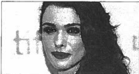
Rachel Weisz er en av skuespillerne i filmen 360.